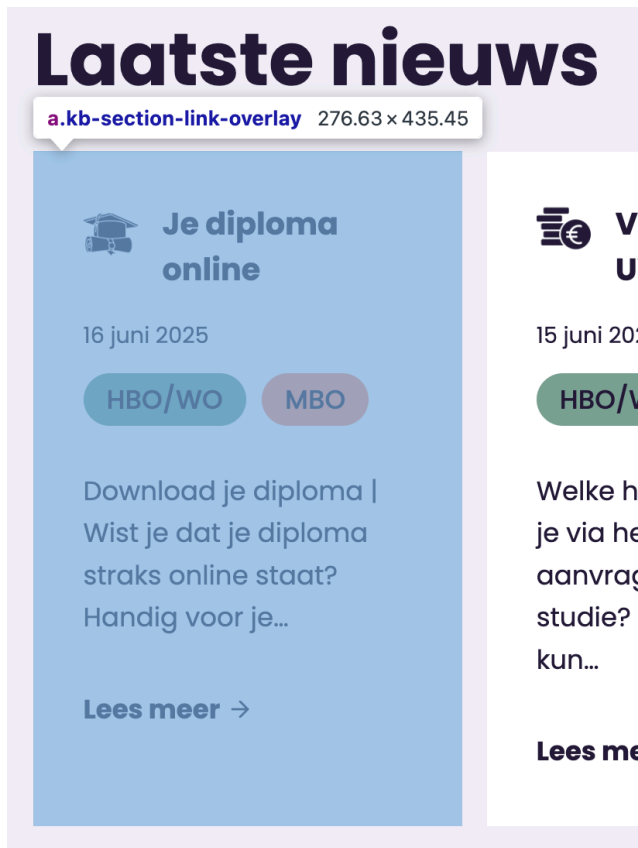
Dubbele link op blok